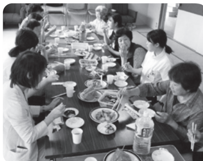
学生を手料理でおもてなし

皆さんのお住まいの地域で「助け合いの取り組みを進めたい」「地域づくりを考えたい！」という方はぜひご連絡ください。