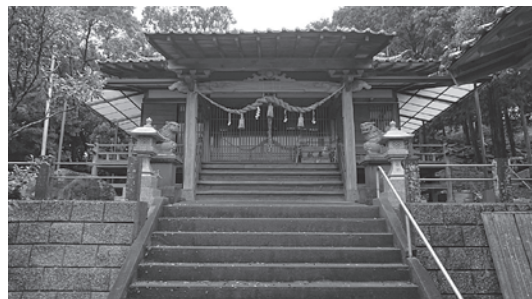
盛国を祭神として祀る舌崎神社（上対馬町京）