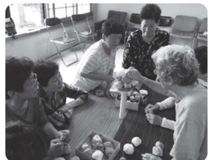
お手玉を使ったゲームで大盛り上がり