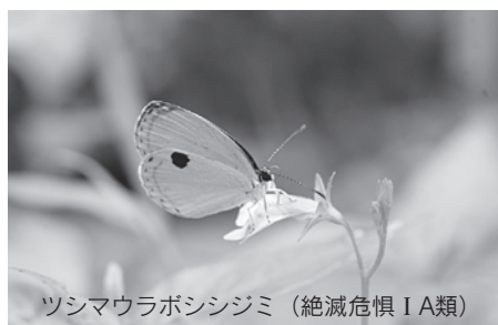
ツシマウラボシシジミ(絶滅危惧IA類)