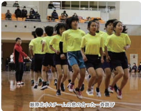
巖原北小Aチームの息の合った一斉跳び

1月12日、大縄跳び大会（第8回）がパールドームで開催されました。市内小学生9チームが参加したこの大会は、8の字跳びと一斉跳びの回数で競いました。結果は、巖原北小学校Aチームが、8の字跳び418回、一斉跳び227回といずれも2年連続の大会新記録で総合優勝に輝きました。