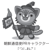
朝鮮通信使PRキャラクター「つしねこ」