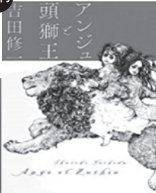
アンジュと頭獅王