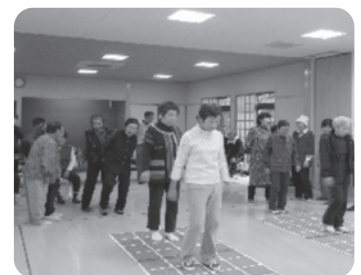
元気にスクエアステップ

各地区で「居心地の良い居場所」「生きがいになる居場所」「笑顔いっぱいあふれる居場所」など、いろいろな居場所を作ってみませんか？