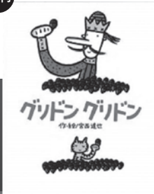
グリドン グリドン