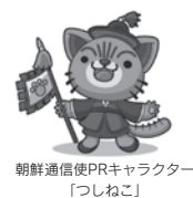
朝鮮通信使PRキャラクター「つしねこ」