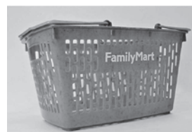
海洋プラスチックごみを再利用した買い物かご