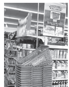
ファミリーマート 対馬厳原大手橋店の様子

※今後も本市の課題解決に向け、島内外の各事業者と連携を強化し、持続可能なしまづくりを進めてまいります。