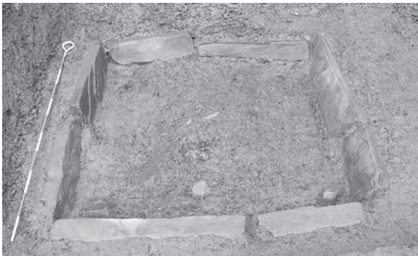
調査で発見された炉跡の遺構（平成29年）

長崎県指定文化財（史跡）として、上県町越高地に位置する越高遺跡が新たに指定されました。過去の発掘調査では朝鮮半島式の炉跡や土器が見つかることから、朝鮮半島から渡ってきた人々が一定期間対馬に定住して現地の人々と交流したと考えられており、県下でも貴重な縄文時代の遺跡です。越高遺跡の詳細については、広報つしま1月号16ページ「対馬歴史人物伝」に掲載しています。