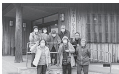
温泉施設で記念撮影