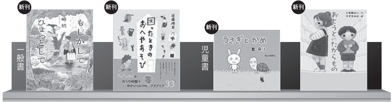
もしかして ひょっとして 大崎 梢/著

トラブルやたくらみに巻き込まれて、お人好しが右往左往。誤解や悪意も呑み込んで、奇妙な謎を解き明かす。にぎやかな6つの短編ミステリー。