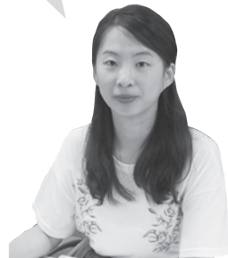
對馬市国際交流員

ファブンチュンイ マニ チョアジョツソヨ ◆ 화분증이 많이 좋아졌어요. → 花粉症がだいぶ良くなりました。