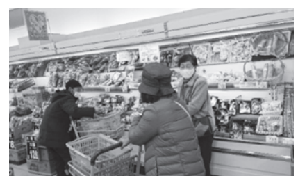
みんなでお買い物