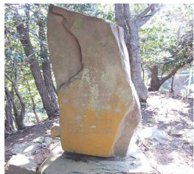
租借地...ある国が他の国の領土の一部 を借りて、一定期間統治すること

上対馬 町豊を出 て鱈浦へ と繋がる 道路脇の 小高い丘 に「青島 陥落記念 碑」が建 つていま す。第一次世界大戦中に、同盟を結ん でいたイギリスの要請を受け大日本帝 国はドイツの租借地・中国山東省の青 島を攻撃、間もない1914年11月に 陥落。日本の勝利を記念し、豊・鱈浦 の有志で建立したのがこの記念碑です。 碑文は風雨にさらされ読みづらくな っていますが、「独ノ策源地タル青島 ヲ攻撃シ興奮、激戦、猛進、肉弾ヲ加 工遂ニ、十一月七日ヲ陥落、ソノ知 略ト武勇トハ世界ヲ震撼セシム」有 志感ズル所アリ記念碑ヲ建立シ毎年陥 落當日コノ地ニ祝杯ヲ上ゲ、益々帝國 ノ武運ヲ将来ニ祈ラントス」など当時 の対馬人の興奮や歓喜が記されています。 無論、戦争は肯定できるものではあ りません。が、先人たちが国を思い、 隆盛を願う、熱く一途な心には考えさ せるものがあります。是非一度お立ち 寄り下さい。