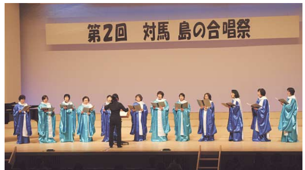
熱唱した「コールカミーリア」ステージ衣装は手作りです。