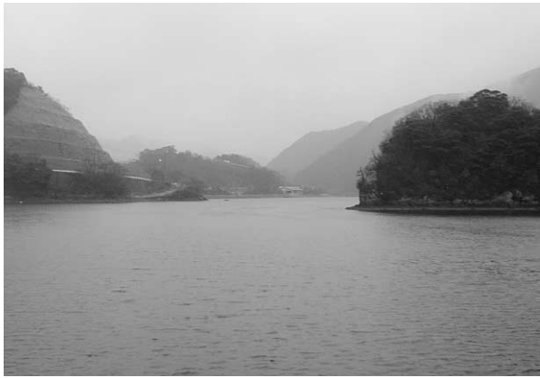
数々の伝説が眠る吉田浦（峰町）

対馬の西海岸に北西に開口した三根湾があります。湾は最大幅0.5km、最深長4kmに達し、湾内の支湾には北岸に狩尾、三根、南岸に田（豊玉町）、賀佐、吉田の集落が形成されています。2500年前の弥生時代前期頃、湾奥は最深長5kmに達していたと推測されます。湾岸一帯は弥生時代の遺跡が多く、三根、吉田からは質、量ともに豊富な考古資料が出土しています。これらの考古資