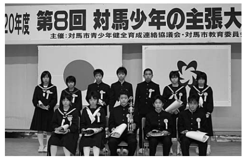
発表した12人の生徒の皆さん

な争いも、大きな戦争もなくなるはず。」「己のごとく人を愛せよ」私はまず自分の身近にいる人を大切に思い、心の輪を、平和の輪を広げていきたいと思っています。いつか必ず、遠くの戦場で銃を持たされる子どもがいなくなるよう。世界が平和になる日が実現できるように。（内容は抜粋、省略し掲載しています。）