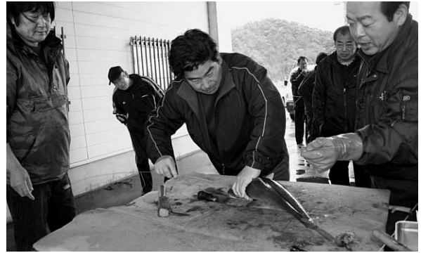
慎重に針を通す漁師さん