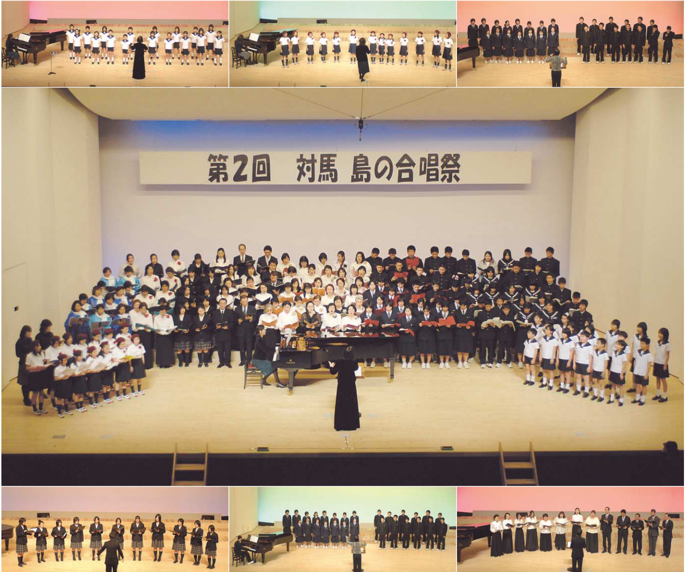
ひびきわたるハーモニーに拍手喝采 第2回 対馬島の合唱祭