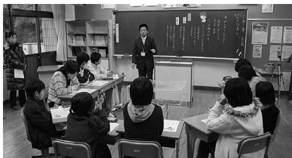
(くじけない強さ「いつも胸をはって」)

1月30日、佐護小中学校推進協力校)において、研究発表会が開催されました。発表会には市内各小・中学校や高校の教職員をはじめ、人権擁護委員、児童民生委員、佐護地区の方々、佐護小中学校PTAなど市内・外を含め約百名を越す多くの参加がありました。 午前中の公開授業では小学5・6年生の道徳と中学生全員による総合的な学習の時間の二つの授業が公開されました。