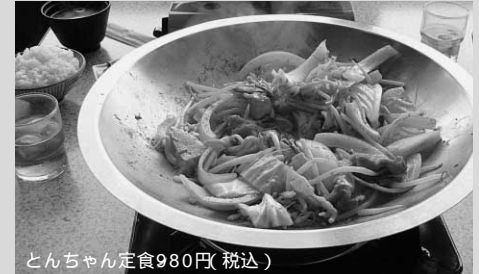
とんちゃん定食980円(税込)

古賀サービスエリアで「とんちゃん」発見! 九州自動車道の古賀サービスエリアで、対馬の「とんちゃん」をアレンジした料理を食べてきました。そのレストランの社長が対馬出身の従業員に意見を聞きながら考案されたもので、豆腐やチャンポン麺が入った味噌(コチジャン?)の効いている煮込み料理でした。私達が食べる本来の「とんちゃん」とはかなり違っていましたが、ボリュームもあり美味しかったです。それより驚いたのは、「とんちゃん」を食べるための専用ルーム、その名も「とんちゃんルーム」(ガラス張り約30席)が作られていることでした。やはり匂いがきついからでしょうか…。メニューでは「対馬名物のとんちゃんをアレンジしたもの」とハッキリ説明がなされていて、対馬出身の方がいるなどところで故郷をPRしてくださっていることに感激しました。(武末)