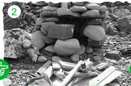
2 石を30センチ位に積み上げます。流木も拾ってきます。