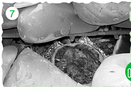
7 ふたをしたらこうやって覗いてはいけません。( )