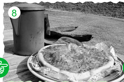
8 20分後、美味しそうに焼き上がりました!