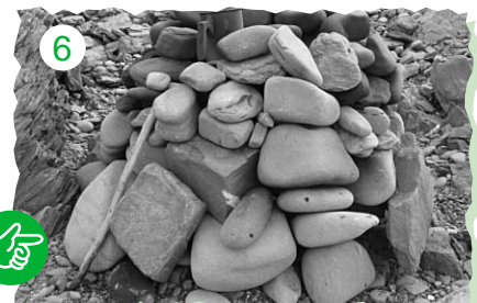
6 入り口をふさぎます。