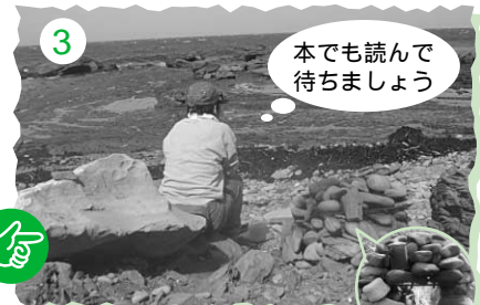
3 さあ、中で木を燃やします。2~3時間位。この間に食材の準備を!!