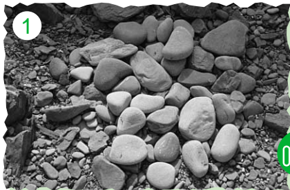
1 小さめの石を床に並べ置きます。

用意するもの... 海岸の石 打ち上げられている流木 遊びココロ&ゆったりとした時間