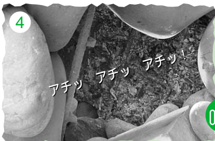
4 燃やし終わると中の灰を掻き出しスペースを作ります。窯の中は熱熱熱!