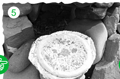
5 今回はピザにしました。