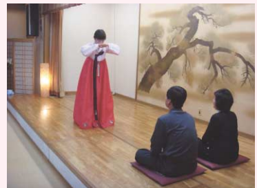
韓国式のお辞儀はこのように両手を肩の高さで合わせ、胡坐をかきながら座って、上半身をゆっくり前に屈めるものです。

家族がみんな集まって、徳談を交わして、和気あいあいな雰囲気になるお正月。このお正月にはおいしいものもいっぱい準備して食べるのですが、その中でもお正月の代表的な食べ物にトクク(トク)です。トク(トク)がお餅、ク(ク)がスープのことで、日本のお雑煮にあたるものです。韓国料理にたくさん使われるごま油の香りが漂うおいしい一品です。