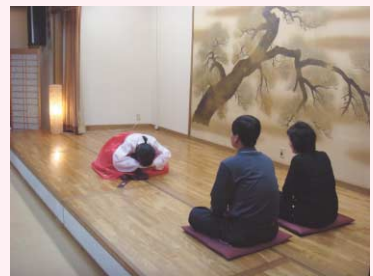
両親が徳談を言います

おいしくて、簡単に作れるトクク！みなさんも是非作ってみてくださいね。韓国ではこのトククを食べて一歳をとると言われています。