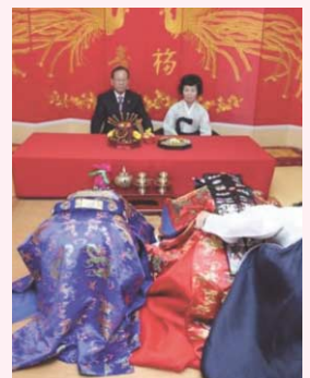
両親に 큰 절 をする新郎と新婦

ウェディングドレスを着て洋風の式を挙げた後は、新郎新婦は伝統衣装に着替え、伝統的な婚礼が行われます。婚礼の伝統衣装は、羽織るものもきれいで派手なもの、頭に被るものも豪華なものになっています。また、新婦の頬に紅をつけるのですが、これは鬼から身を守る意味があります。新郎と新婦が、腕を絡めて杯を交わし、新郎が新婦をおんぶして部屋を一周する儀式がありますが、ここでも両親に 큰 절 をします。