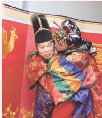
新婦をおんぶして部屋を一周する新郎