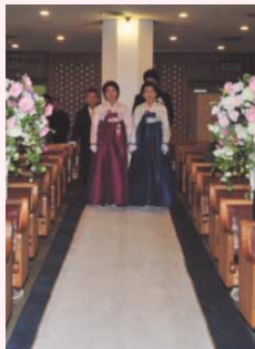
手をつないで登場する 両家の母親

それから、友達の祝賀の歌などが続きますが、ここで、韓国ならではのものがあります。韓国では、新郎が愛をこめて新婦に歌を捧げることが多いです。歌がうまいと賞賛の拍手が、歌が下手だと激励の拍手が起こり、一番盛りあがる時間です。