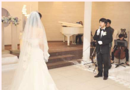
新婦に歌をささげる新郎の姿

また、儒教の影響で、両親を大事にする韓国では、両親にお辞儀をする時間があります。今まで育ててくれた両親に心を込