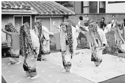
厳原町曲の盆踊り