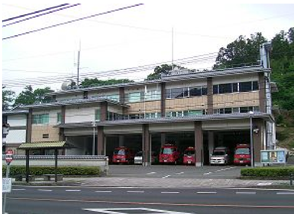
消防本部・消防署