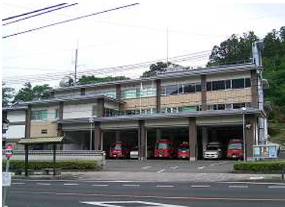
消防本部・消防署