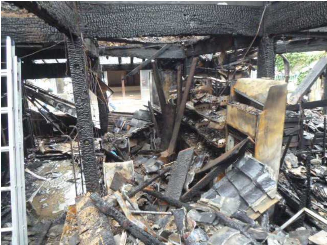
建物火災 現場写真