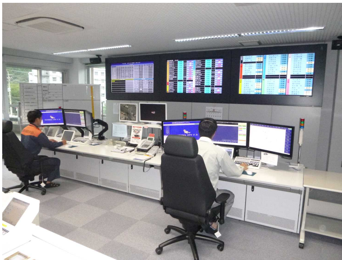
通信指令台システム