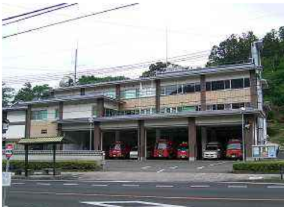
消防本部・消防署