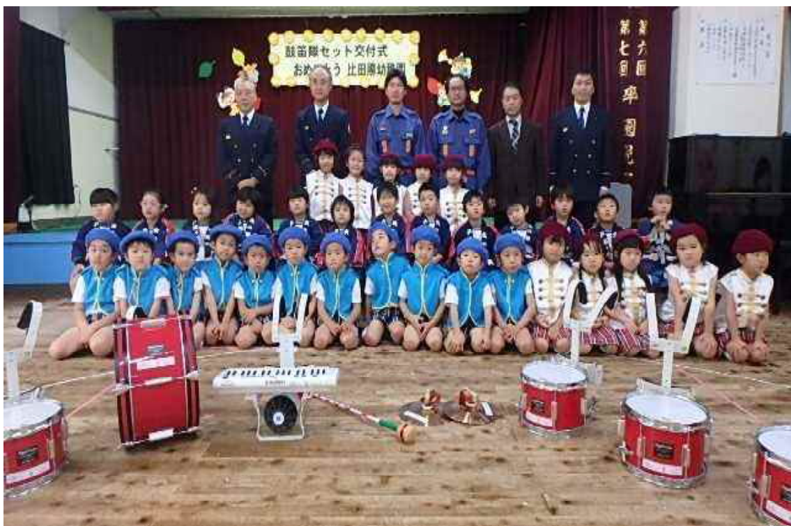
幼年消防クラブ 鼓笛隊セット交付式