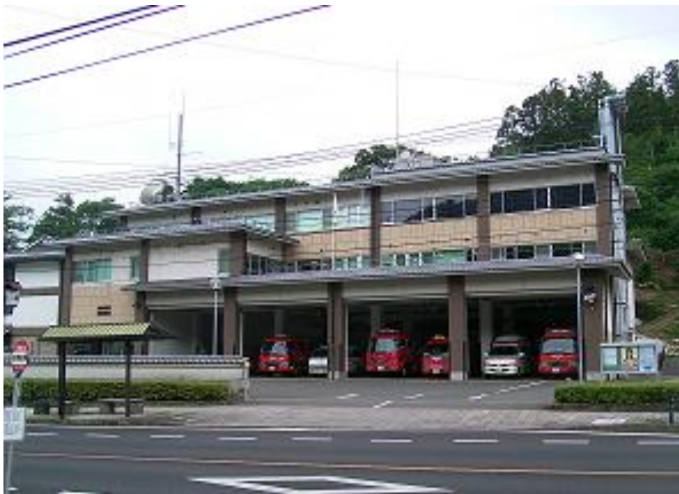
消防本部・消防署