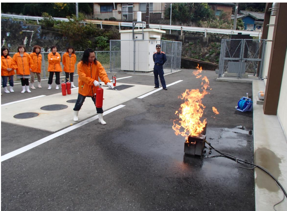
婦人防火クラブ消火訓練