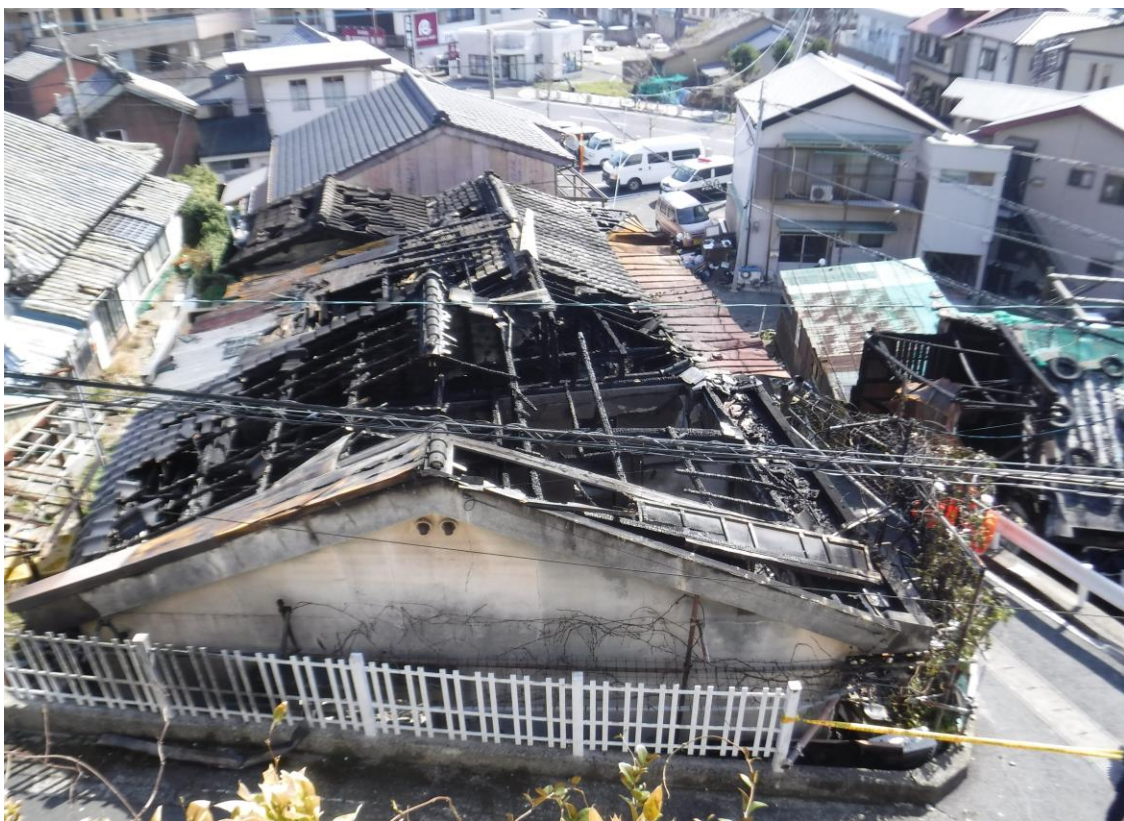
巖原町国分（建物火災）