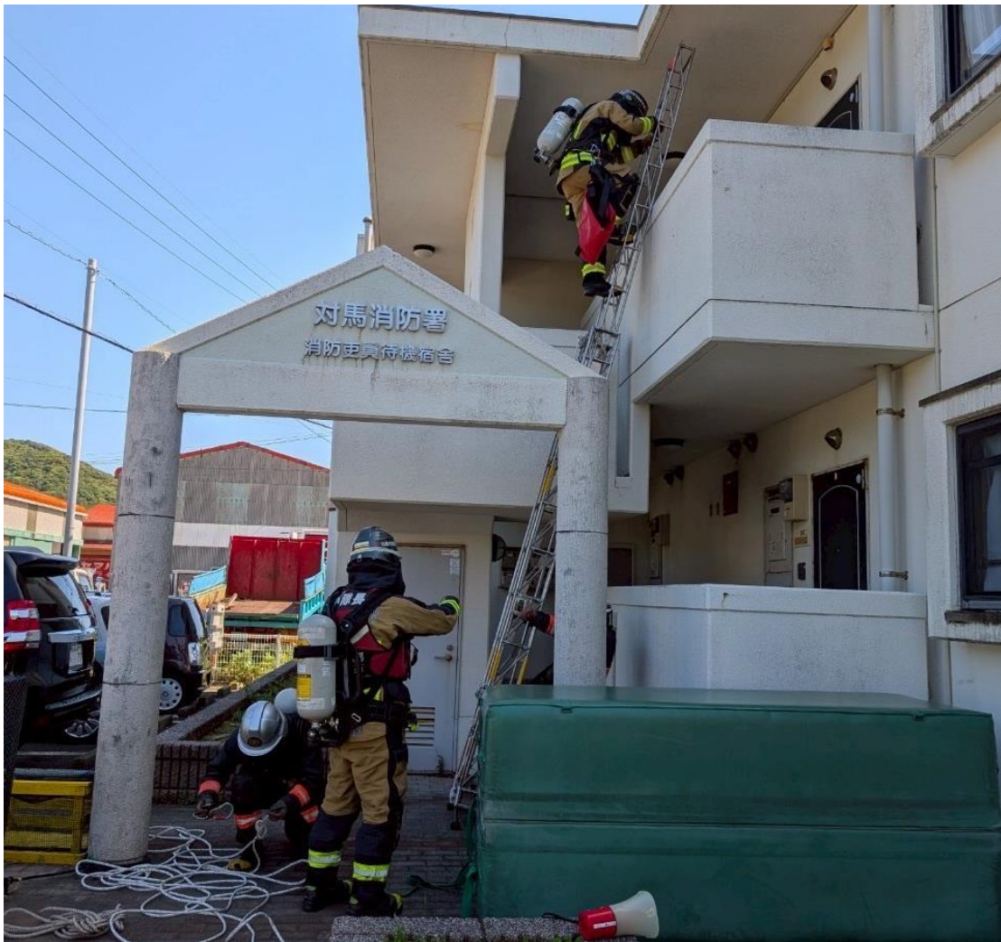
建物火災を想定した実戦訓練