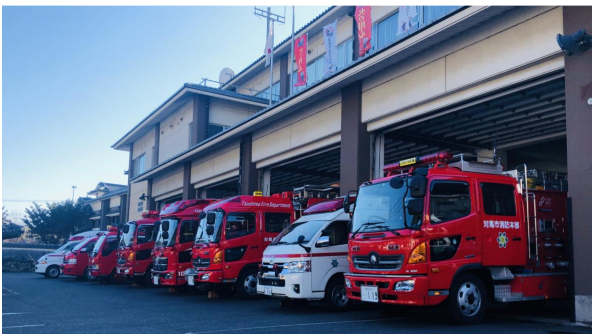
対馬市消防本部庁舎