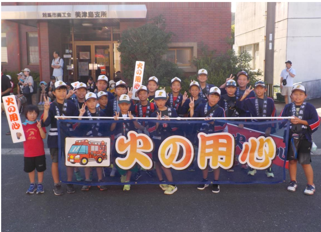
鶏鳴小学校少年消防クラブ 防火パレード