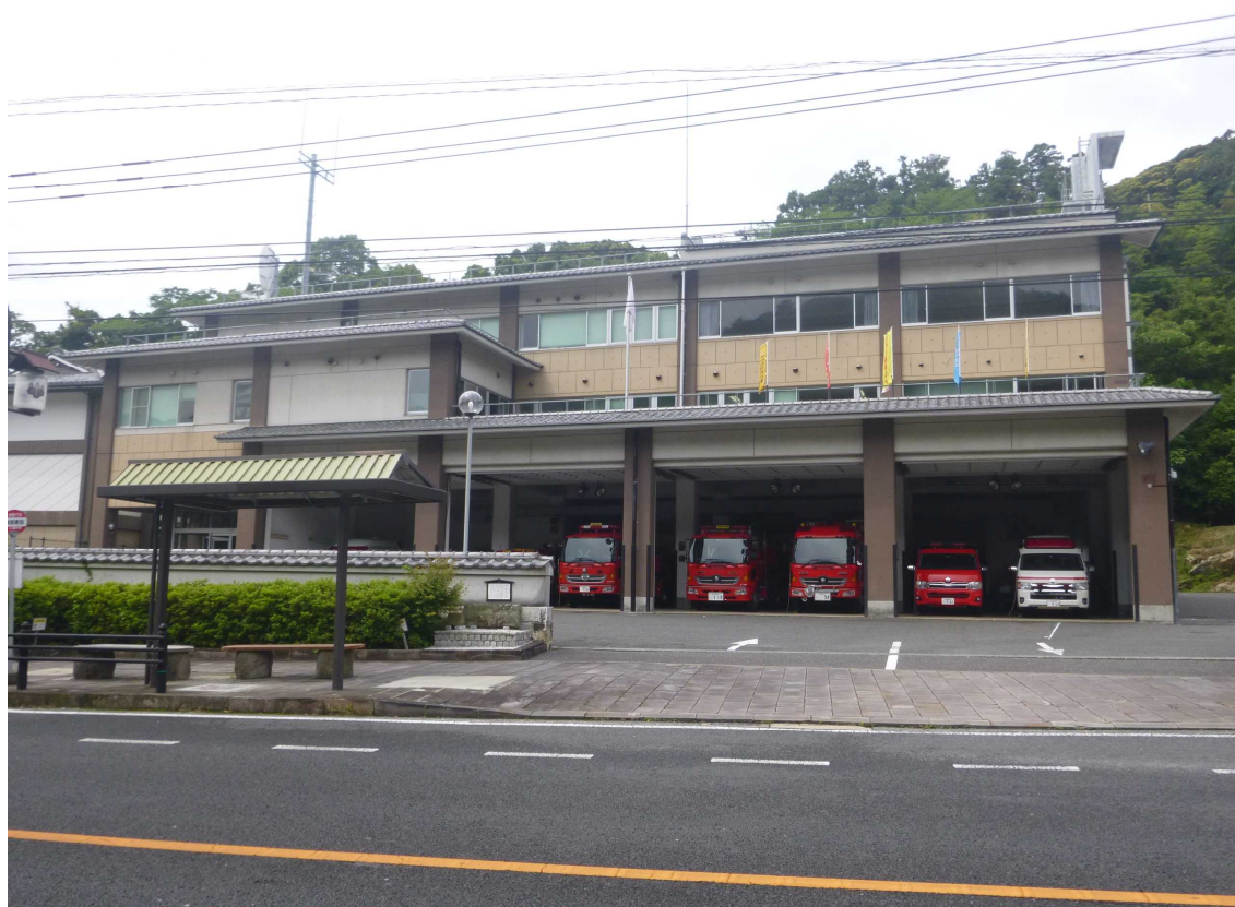
消防本部・消防署