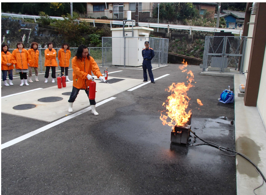
婦人防火クラブ消火訓練