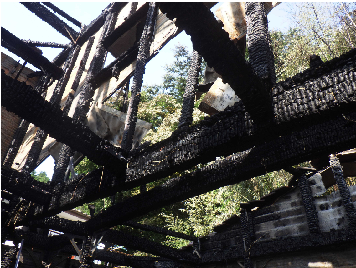
建物火災 現場写真