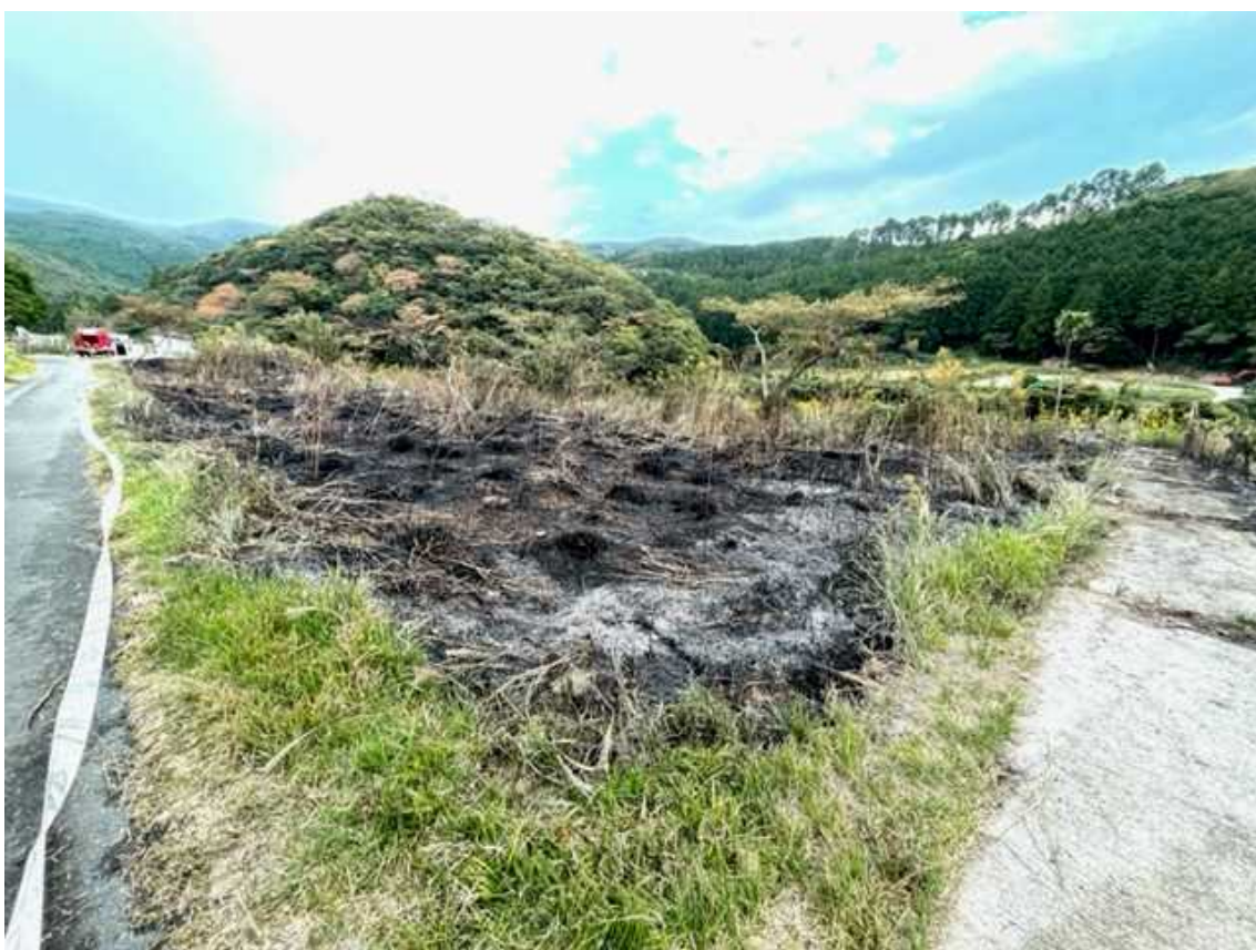
久根浜（その他の火災）