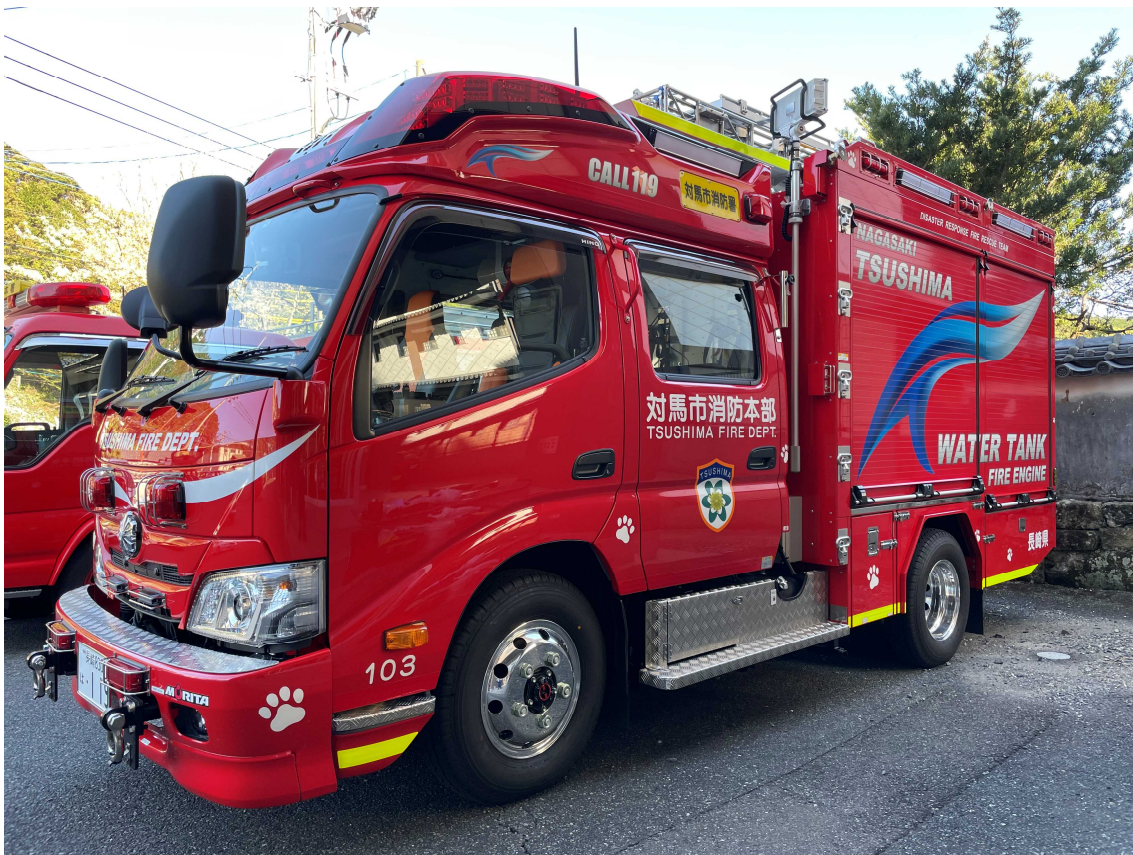
令和2年度消防ポンプ自動車購入事業（600ℓ水槽搭載型）