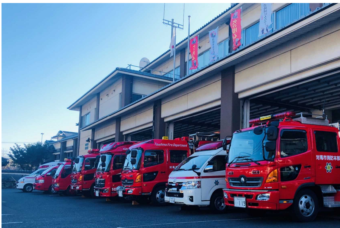
対馬市消防署 庁舎及び車両