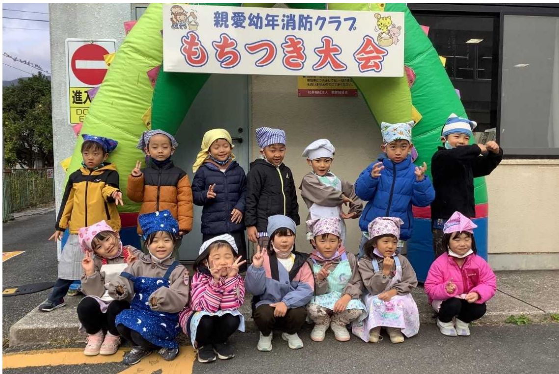
親愛こども園幼年消防クラブ もちつき大会