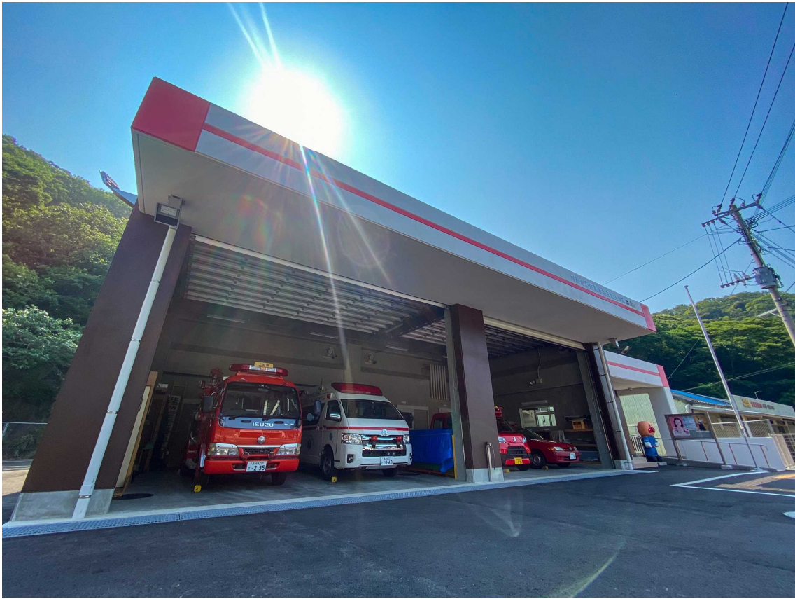
対馬市消防署 北部支署 上対馬出張所 移転 R4.2.21 運用開始