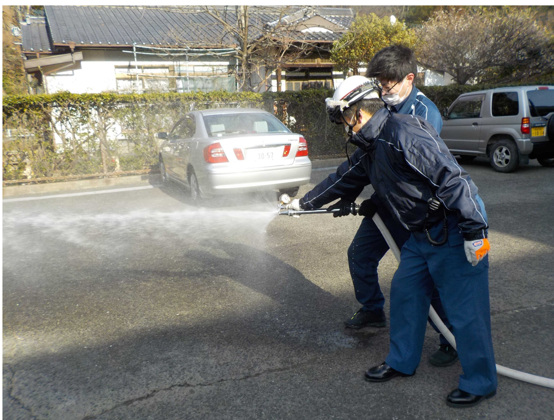
屋内消火栓放水圧力確認状況