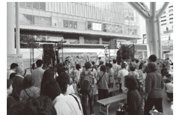
対馬観光物産展in福岡