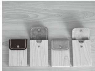
レザークラフト (名刺入れ・印鑑ケース等)