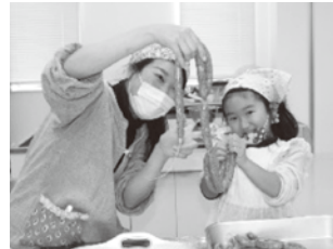
ソーセージ作り体験