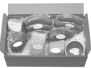
食肉加工製品 (ソーセージ・ベーコン等)