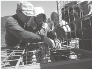
地区捕獲隊の活動