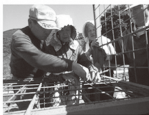
地区捕獲隊の活動