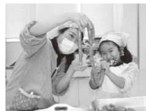
ソーセージ作り体験