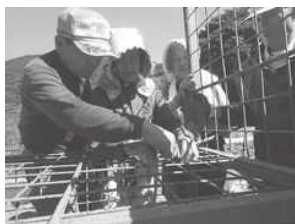
地区捕獲隊の活動