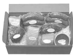
食肉加工製品 (ソーセージ・ベーコン等)