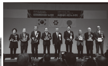
平成29年10月31日「朝鮮通信使に関する記録」がユネスコ記憶遺産に登録されました！