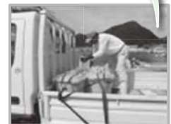
対馬農協が生ごみを回収！