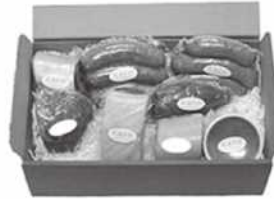
食肉加工製品 (ソーセージ、ベーコン等)