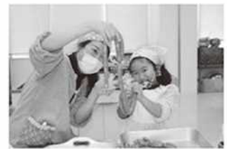
ソーセージ作り体験