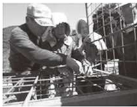
地区捕獲隊の活動