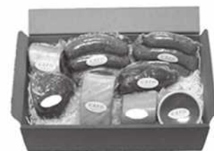
食肉加工製品 (ソーセージ、ベーコン等)