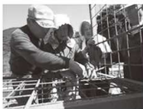
地区捕獲隊の活動