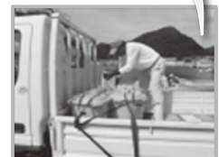
対馬農協が生ごみを回収！