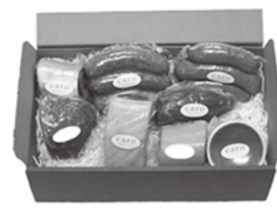
食肉加工製品 (ソーセージ、ベーコン等)