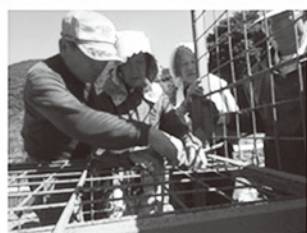
地区捕獲隊の活動