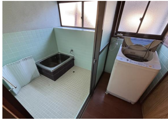
浴室②+洗濯機置き場