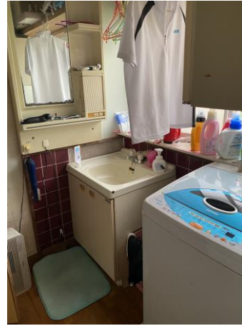
洗面台、洗濯機置き場