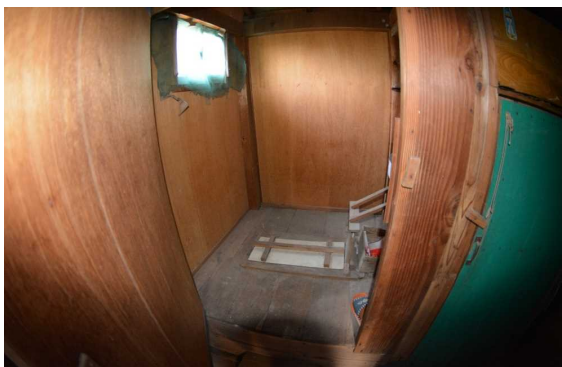
トイレ(和式汲み取り)