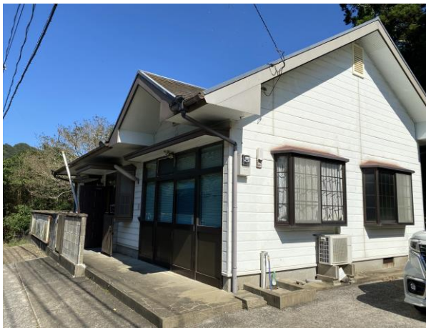
外 観 (側面)