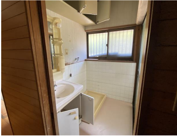
洗面台・洗濯機置き場