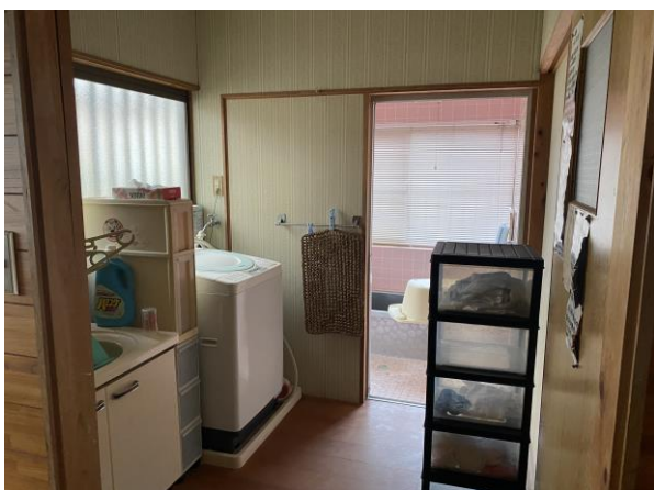
洗面台+洗濯機置き場