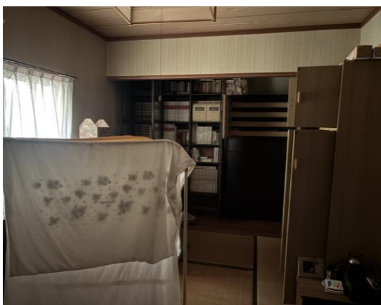
和 室 (2階)