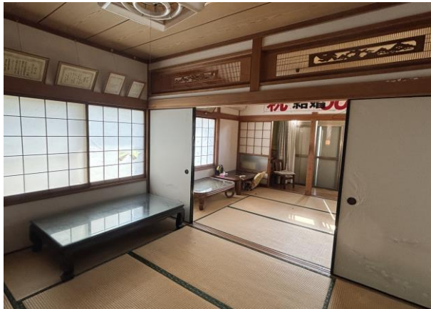
和 室 (1階)