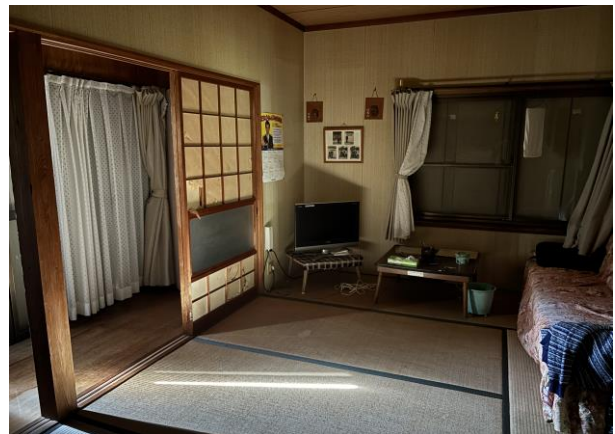
和 室 (2階)