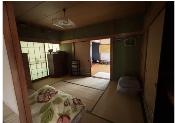
和 室 (1階)