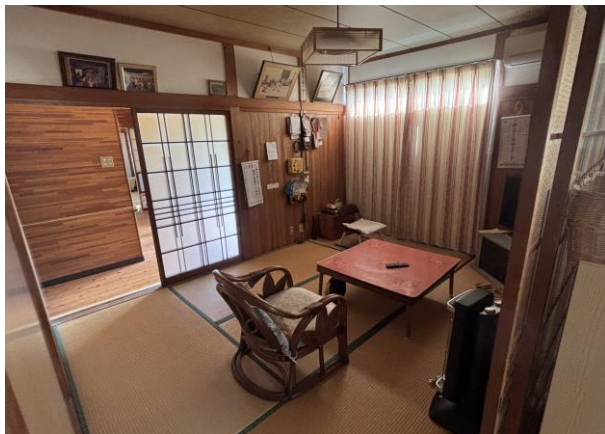
和 室 (1階)