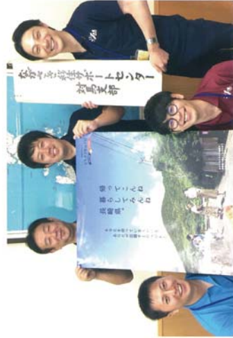
仕事情報を数多く集約しており、相談者の希望に合致した求人情報を紹介している

対馬の衣食住に関するいろんなことに詳しいスタッフが移住をサポート。補助金制度や空家利用など移住に関する総合窓口。