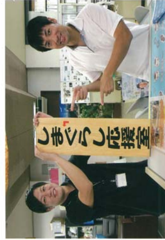
厳原町にある市役所の4階にある「しまぐらし応援室」。 まずはお気軽にお電話ください!!

「対馬に住みたい!!」をサポートする対馬市や長崎県の窓口や、移住に向けた準備段階でのサポート制度を紹介。移住にまつわる不安や心配事など何でも相談できる窓口。