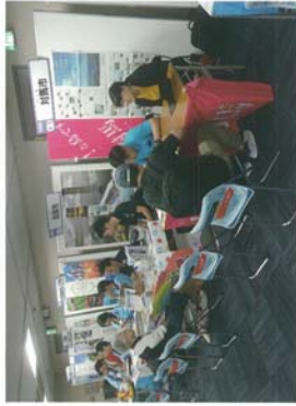
移住相談会の様子