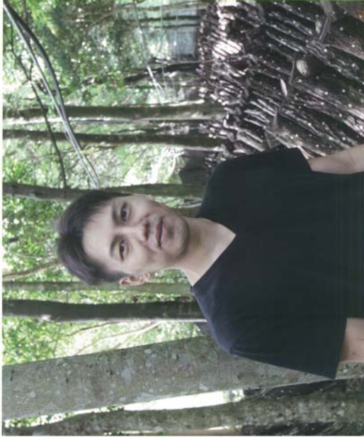
就業DATA ■ 生産作物 ■ 原木しいたけ ■ 家族 妻・娘の3人家族