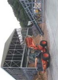
バイオマス原料加工工場

木材を5cm角のチップに加工し、バイオマス発電の燃料として出荷。大量のチップを貨物船で出荷する。