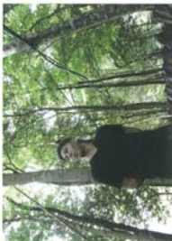
原木しいたいけ栽培

原木を使ったしいたいけ栽培は基幹産物の1つ。現在、対馬では、若手生産者が栽培の担い手として活躍中。