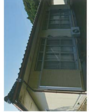
対馬市蔵原町日吉にある「移住お試し住宅」